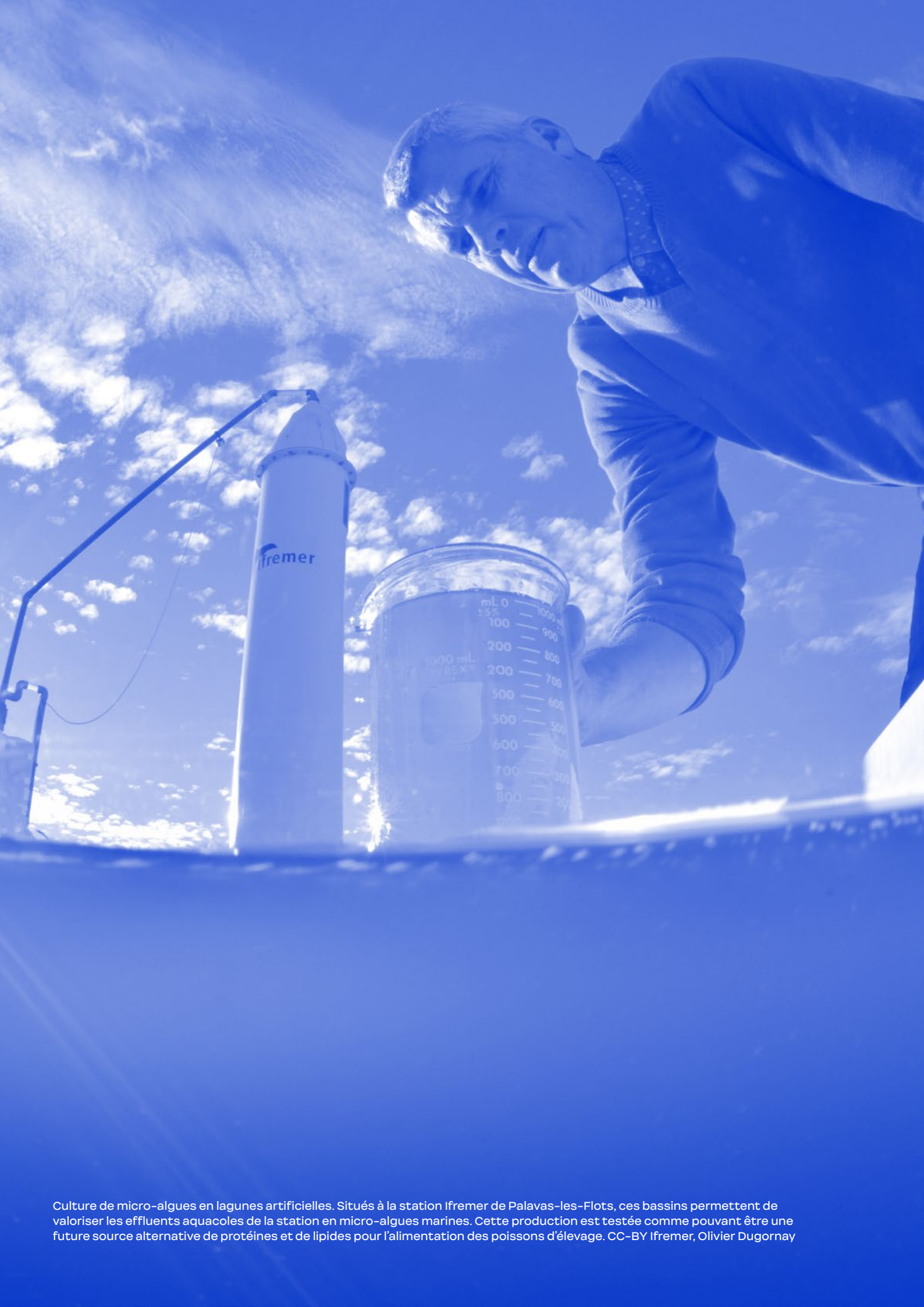
Culture de micro-algues en lagunes artificielles. Situés à la station Ifremer de Palavas-les-Flots, ces bassins permettent de valoriser les effluents aquacoles de la station en micro-algues marines. Cette production est testée comme pouvant être une future source alternative de protéines et de lipides pour l'alimentation des poissons d'élevage.